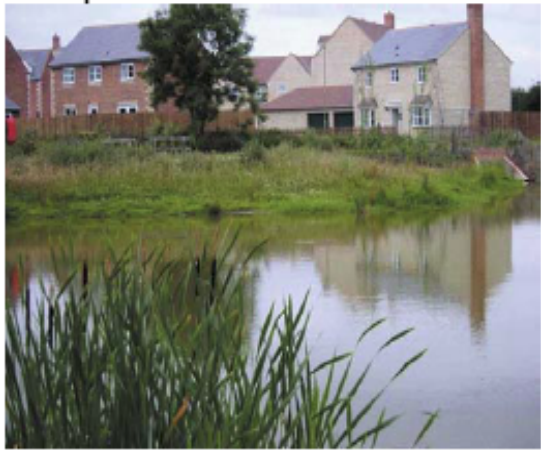
SUDS pond, housing development, Bicester